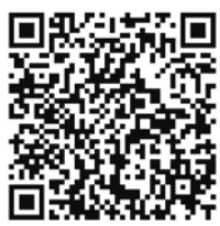
申し込みフォーム

皆様のご参加お待ちしております！お問合せ TEL:026-222-2117(水橋)